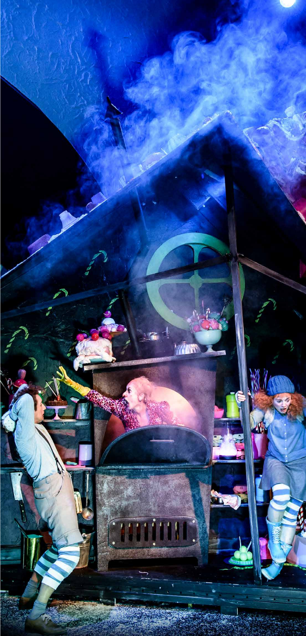
Fra forestillingen Hans og Grete