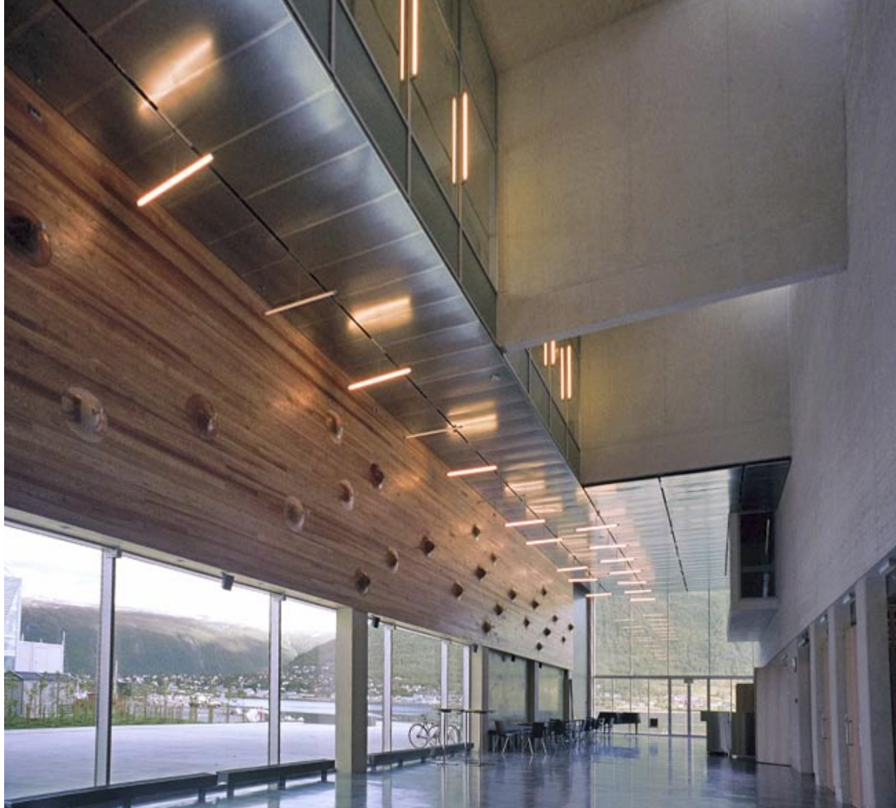
Foajéen sett mot sundet. Askeveggen med innfelle former av heltre er en utsmykning skapt av Martine Linge.