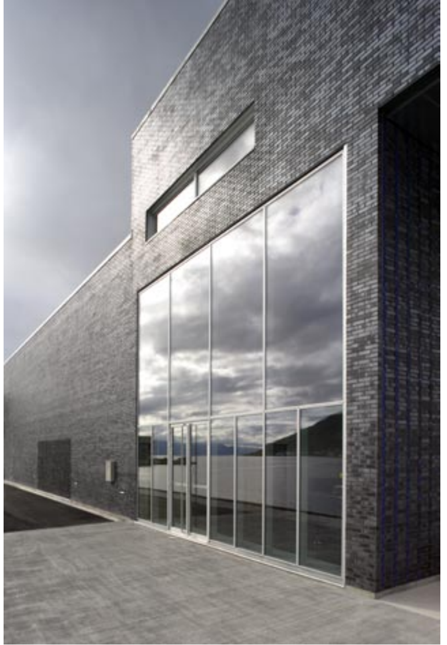
Tromsøysundet speiler seg i glassveggen i enden av foajéen