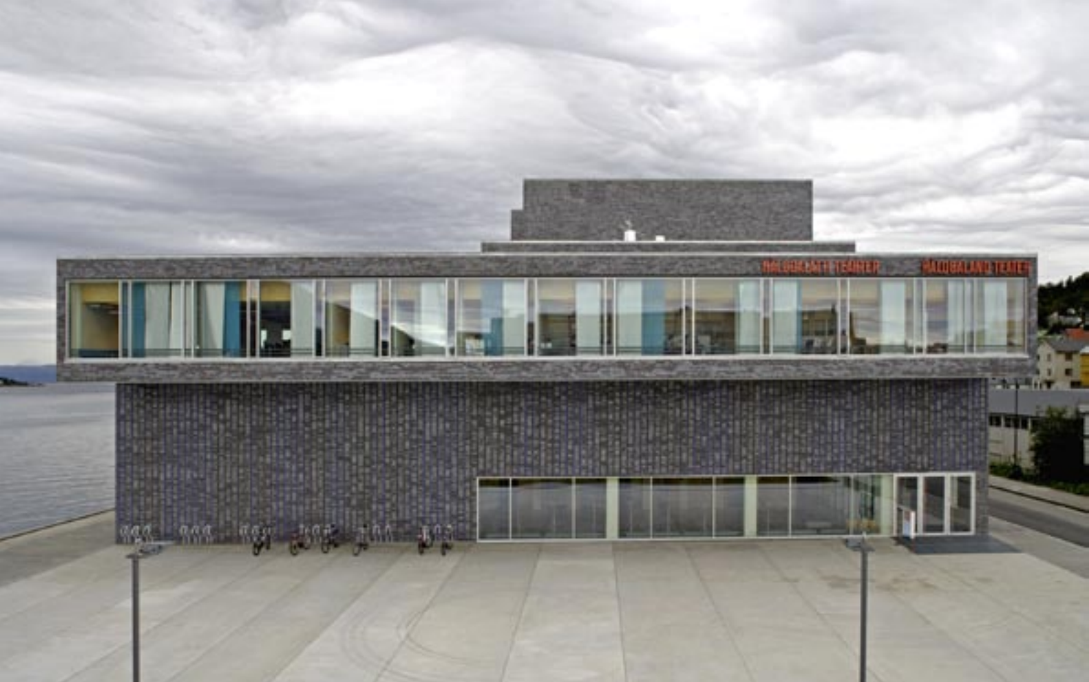
Fasaden mot teaterplassen. Teglgveggen under den utkragede administrasjonsfløyen er et utsmykningsprosjekt skapt av Inge Pedersen.