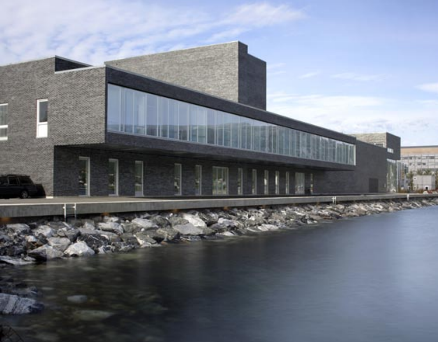
Skuespillergarderobene krager ut over strandpromenaden langs Tromsøysundet

mye i forhold til skiftende lysinnfall og refleksjoner. Steinene har i tillegg stor innbyrdes variasjon, slik at det også på nært hold er variasjon i flatens uttrykk.