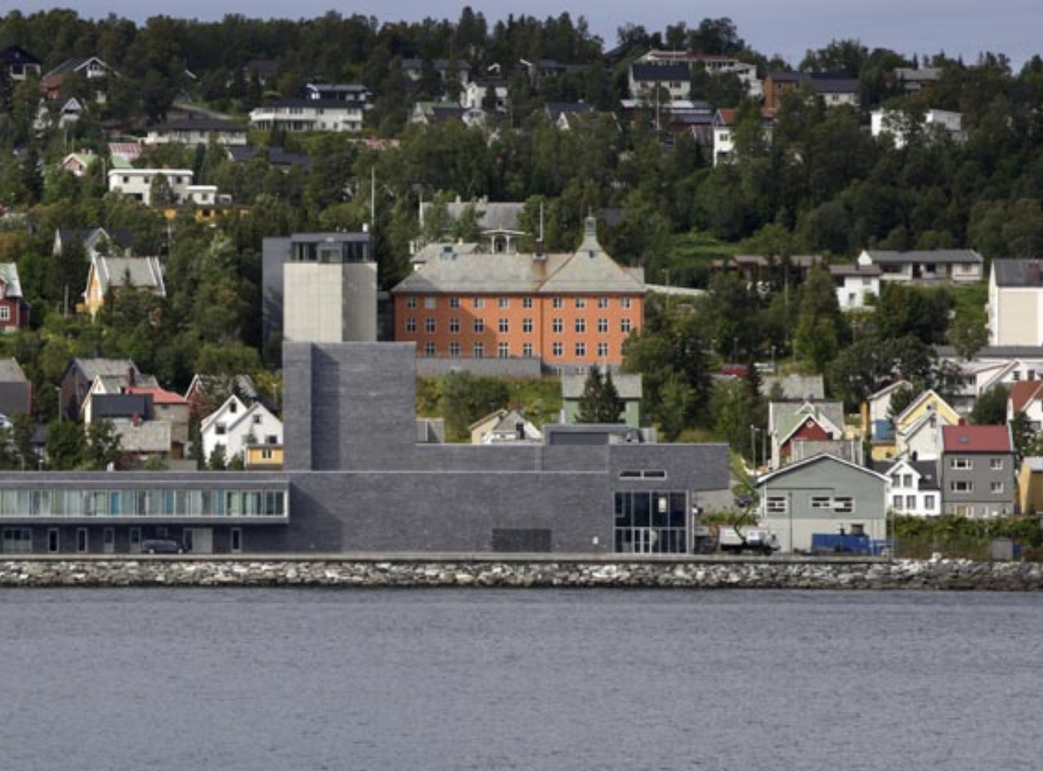
Hålogaland Teaters nybygg står i et variert bygningsmiljø

Det er variert med forskjellige typer teglforband og stussfugebredder i fasadene. Vist her utsnitt av løperforband og «perforert» forband med vindusfelt bak.