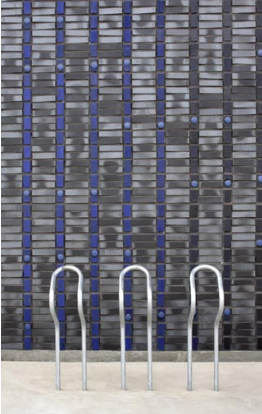
Utsnitt av den kunstnerisk bearbejdede teglveggen mot forplassen.